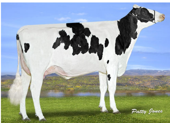
PROGENESIS MONTANA BEAUVAIS THIRD DAM